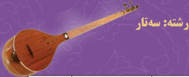
رشته: سه تار